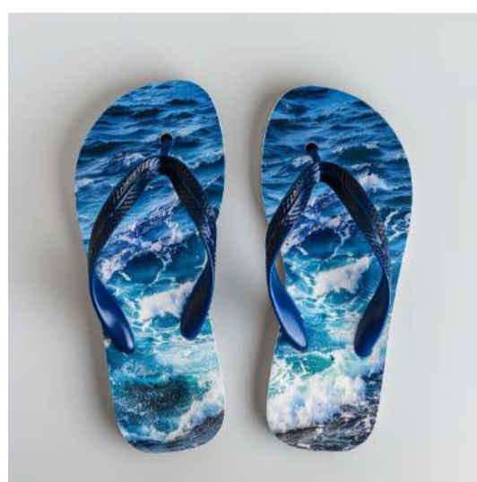
TRAVAR AS ALTERAÇÕES CLIMÁTICAS FREEZING GLOBAL WARMING