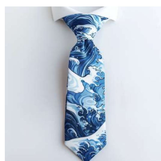
LIDERAR PELO EXEMPLO LEADING BY EXAMPLE