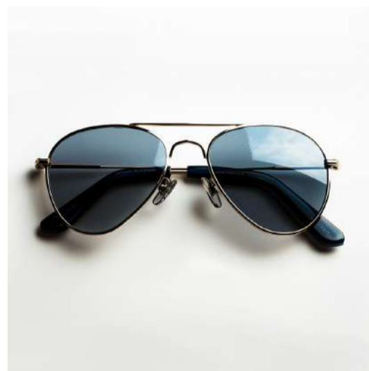
CONGELAR O AQUECIMENTO GLOBAL STOPPING CLIMATE CHANGE