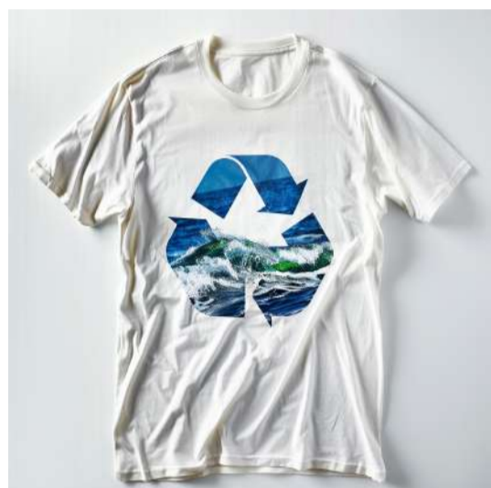
LIMPAR O LIXO MARINHO CLEANING UP MARINE LITTER