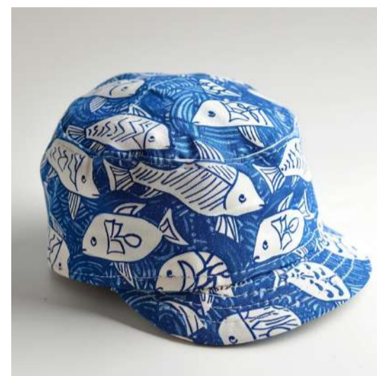
RECUSAR A SOBREPESCA REFUSING OVERFISHING